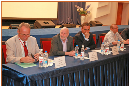
Окончание. Начало на с.1. День 1. Открытие конференции

На церемонии открытия присутствовал и вице-губернатор Евгений Альбертович Харичкин. В своем выступлении он передал приветствие участникам конференции от имени администрации Волгоградской области и лично главы Андрея Ивановича Бочарова. Для волгоградского региона, отметил замгубернатора, глубоко символично, что эта конференция проводится в стенах ВолгГТУ, которому в конце мая исполнилось 85 лет. Это говорит о признании вуза, успешно решающего важнейшую задачу – подготовку кадров для волгоградского региона, Южного федерального округа, страны в целом. Е.А. Харичкин подчеркнул важную роль этой конференции не только в научном, но и в практическом плане, в том числе для Волгоградской области, имеющей большой промышленный потенциал, развитую химическую отрасль. Он также выразил благодарность всем прибывшим на форум ученым, изыскавшим возможность посетить волгоградскую землю в год 70-летия Великой Победы. И пожелал им плодотворной работы, новых творческих планов.